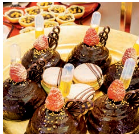
Delicias después de la cena.