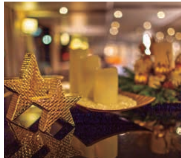
Ambiente navideño a bordo.