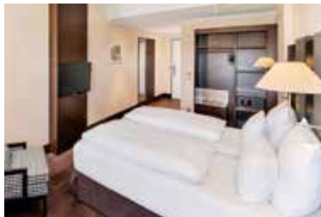
Hotel NH Munich City Sud www.nh-hotels.com