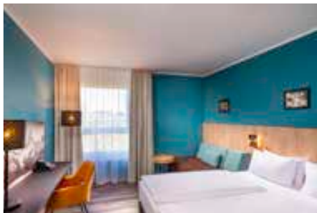
Hotel Mercure Munchen Neuperlach Sud all.accor.com