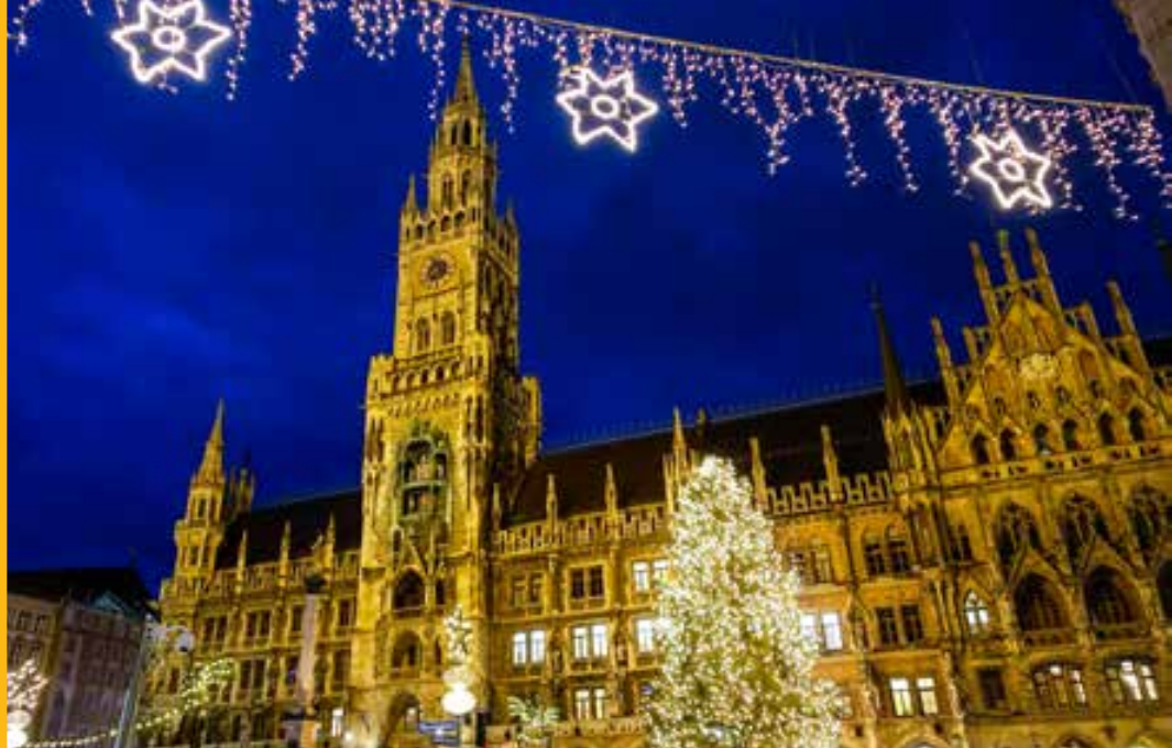
Mercado de Navidad en Marienplatz MUNICH