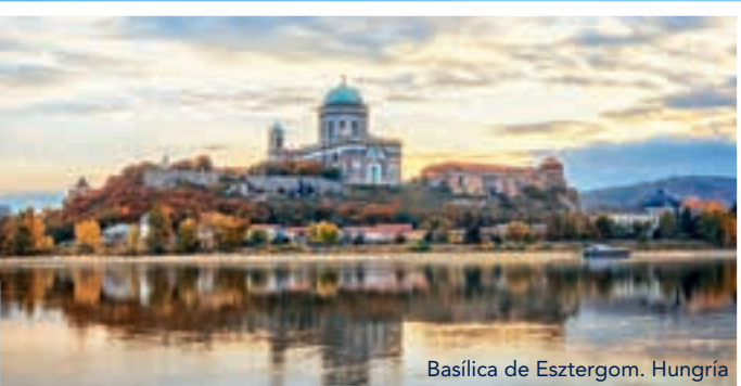
Basilica de Esztergom. Hungría