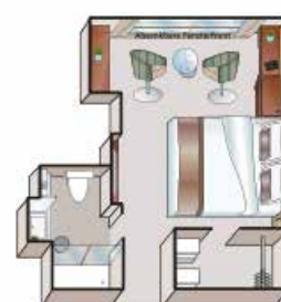
Camarote Mozart y Strauss