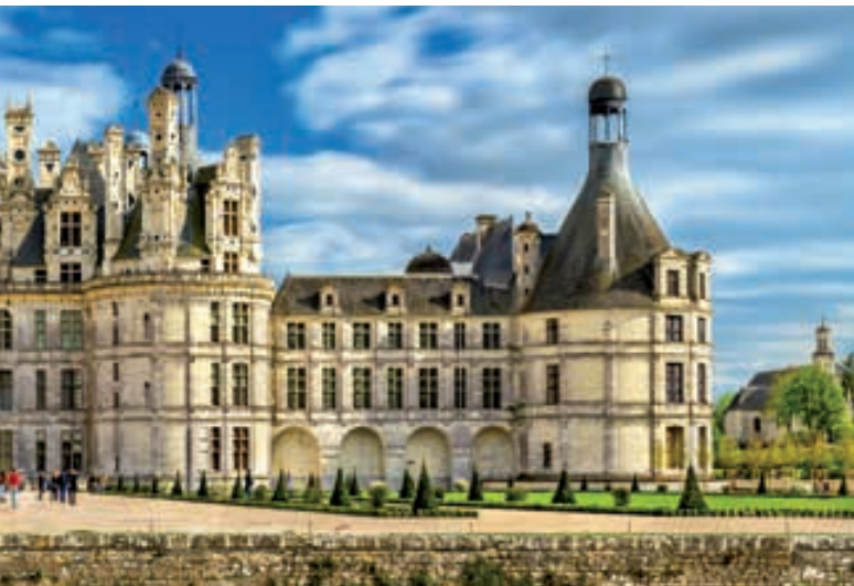
Castillo de Chambord

jardín ornamental, jardín de agua, y el laberinto. Continuación hacia Tours. Cena y alojamiento.