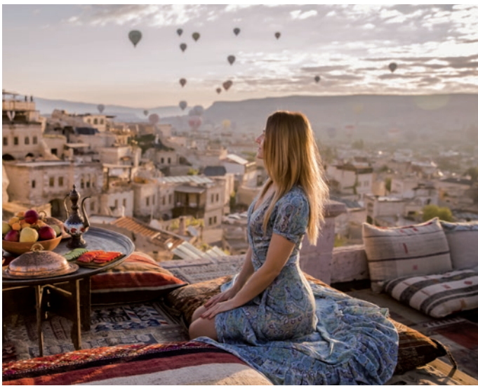
Paisaje de Capadocia

de Eyüp, desde donde se obtiene una de las vistas más reconocibles del estuario. Proseguiremos por Fener y Balat, antiguos distritos griego y judío, conocidos por sus calles empedradas, fachadas de colores y templos históricos; allí se encuentra el Patriarcado Ecuménico de Constantinopla y la Catedral de San Jorge, sede espiritual de la comunidad ortodoxa. Almuerzo (PC). Por la tarde, recorrido por la Plaza de Taksim y la calle Istiklal , arteria peatonal llena de comercio, cafés y arquitectura de finales del XIX. Cena y alojamiento