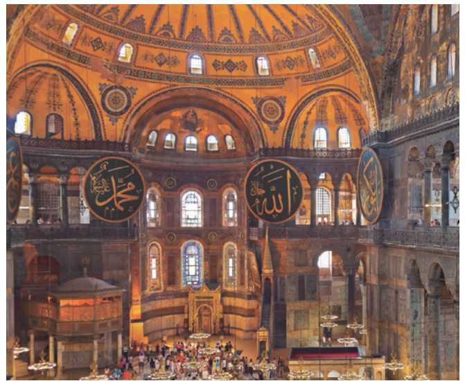
Interior Santa Sofía