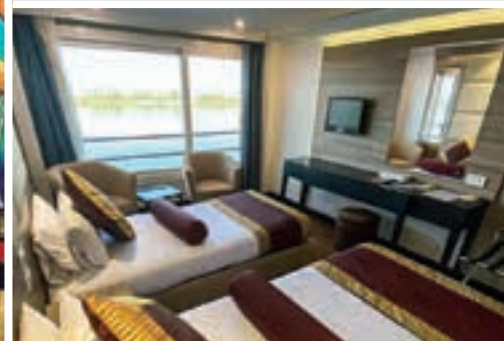
Barco MS Nile Marquis 5****