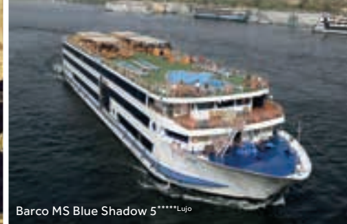
Barco MS Blue Shadow 5****Lujó