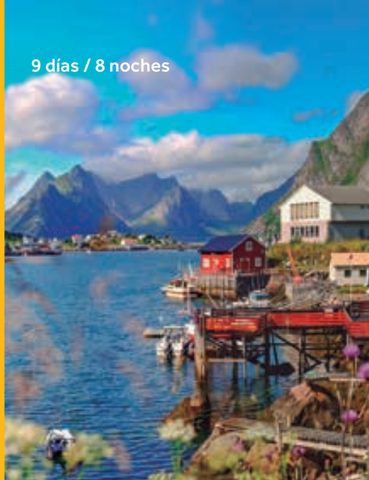
Islas Lofoten. NORUEGA.