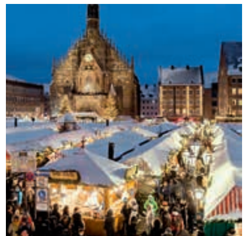
Núremberg: mercadillo de Navidad.