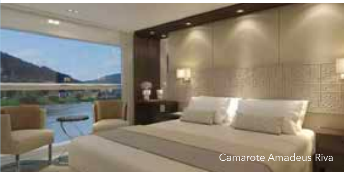
Camarote Amadeus Riva