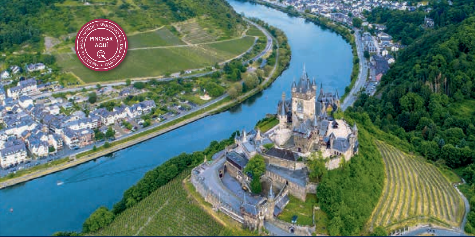
El Castillo de Reichseurg en la ciudad de Cochem, en el río Mosella.